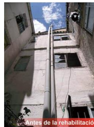
Antes de la rehabilitación

OBRAS EN EL EDIFICIO A COMUNIDADES DE PROPIETARIOS O PROPIETARIOS DE VIVIENDAS UNIFAMILIARES CON RENTAS LIMITADAS O QUE CEDAN VIVIENDAS A LA BOLSA MUNICIPAL DE ALQUILER.